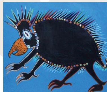
Oben – Francois Iloki: Stacheliges Tier. Tempera, um 1955