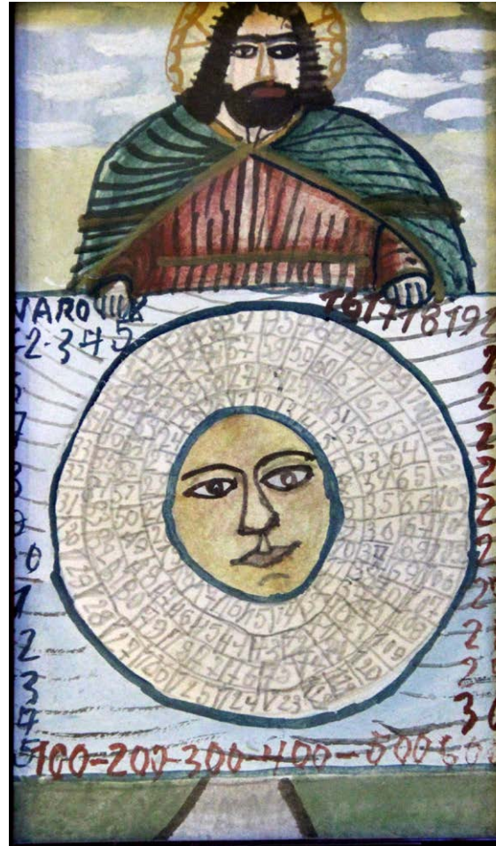
Nikifor. Heilige in weiß. Aquarell. o.J.