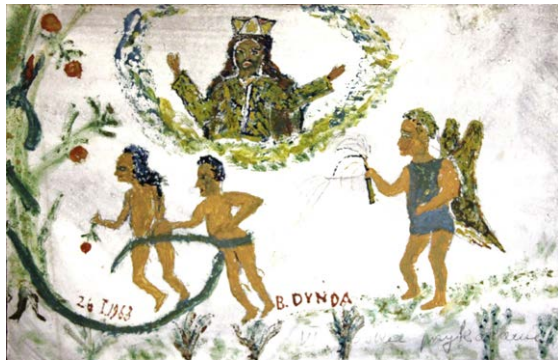
Boleslav Dynda. Vertreibung aus dem Paradies. Öl/Hartfaser. 1973

Die Ausstellung versammelt ausgewählte Werke aus dem Themenschwerpunkt der sogenannten Outsider Art innerhalb der Sammlung Rolf Italiaander. Sie wurde zusammengestellt und kuratiert von Bernd Kraske, Vorstand der Stiftung Sammlung Italiaander/Spegg, gemeinsam mit Rik Reinking, Gründer des WAI – Woods Art Institute in Wentorf. Das WAI befindet sich in unmittelbarer Nähe zum Reinbeker Schloss, in dessen historischer Umgebung die Werke gezeigt werden. In den Räumlichkeiten der „Alten Küche“ bietet sich ein konzentrierter Blick auf eine Kunst, die sich bewusst jenseits akademischer Konventionen verortet.