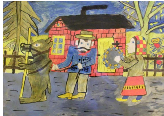
Carl Christian Thegen. Vorführung eines Tanzbären. Aquarell. o.J.

Outsider Art wurde häufig auch mit dem Begriff der „Naiven Kunst“ belegt, doch entzieht sie sich einfachen Kategorisierungen. Gerade mit dem Begriff „naiv“ verbinden sich Zuschreibungen, die es kritisch zu befragen gilt. Denn was vermeintlich einfach, ungeschult oder unperfekt erscheint, ist in Wahrheit oft Ausdruck einer eigenständigen, inneren Logik. Diese Werke folgen keiner erlernten Bildsprache, sondern sie entstehen aus einem unmittelbaren, persönlichen Zugang zur Welt. Sie entspringen nicht einem gesellschaftlichen Kanon, sondern einer inneren Notwendigkeit des Ausdrucks.