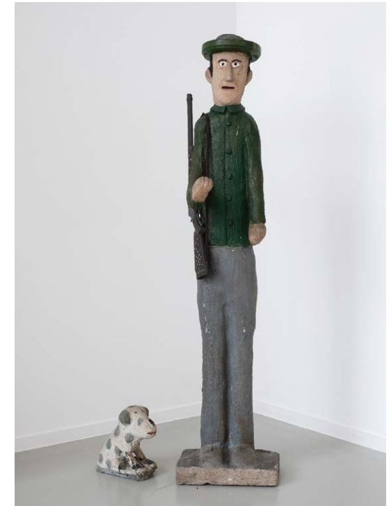
Erich Bödeker. Jäger mit Hund. Holz/Zement bemalt. Frühe 1960er

Der Titel der Ausstellung „Logik der Träume“ weist auf diese besondere Qualität: eine Logik, die weniger dem rationalen Verstehen als vielmehr dem Traumhaften, Intuitiven und Inneren verpflichtet ist. Unser Verstand mag die reduzierte oder doch ungewohnte Formensprache zunächst als Bruch gängiger ästhetischer Maßstäbe wahrnehmen. Doch gerade darin liegt ihre Stärke: Die Bilder und Objekte in dieser Ausstellung sprechen direkt zur Seele. Sie umgehen intellektuell gesetzte Normen und eröffnen dafür einen emotionalen Resonanzraum, in dem sich eine tiefe, oft überraschende Nähe ergibt. Das ist keine geringe, sondern eine wesentliche Qualität von Kunst.