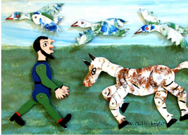
Willi Mühlhaupt. Auf der Pferdekoppel. Collage/Öl/Hartfaser. 1974

Die Ausstellung versammelt ausgewählte Werke aus dem Themenschwerpunkt der sogenannten Outsider Art innerhalb der Sammlung Rolf Italiaander. Sie wurde zusammengestellt und kuratiert von Bernd Kraske, Vorstand der Stiftung Sammlung Italiaander/Spegg, gemeinsam mit Rik Reinking, Gründer des WAI – Woods Art Institute in Wentorf. Das WAI befindet sich in unmittelbarer Nähe zum Reinbeker Schloss, in dessen historischer Umgebung die Werke gezeigt werden. In den Räumlichkeiten der „Alten Küche“ bietet sich ein konzentrierter Blick auf eine Kunst, die sich bewusst jenseits akademischer Konventionen verortet.